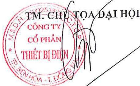
Đặng Phan Tường